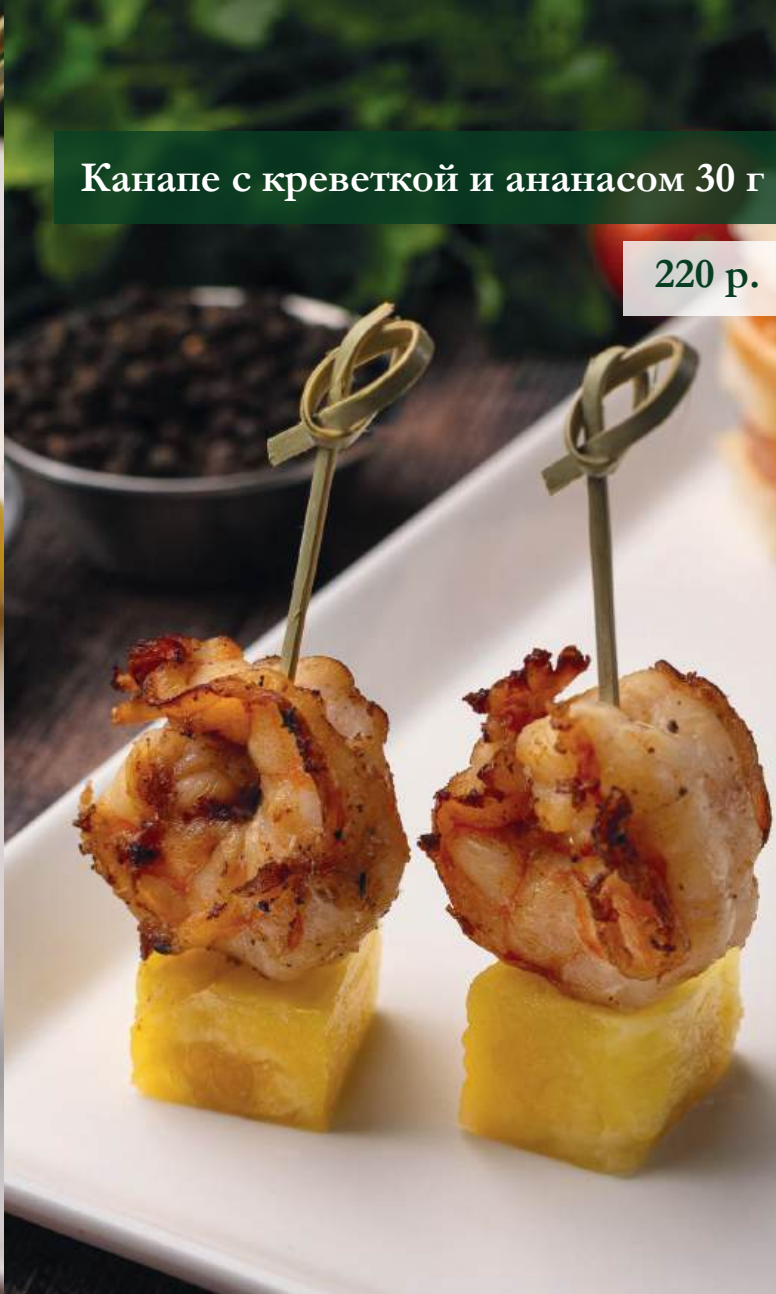
Канопе с креветкой и ананасом 30 г